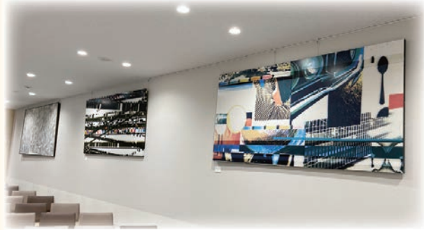
木村 嘉子《作品口》《作品 3-82》《JOH40-S》